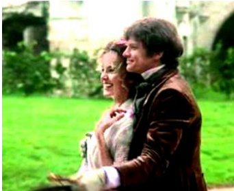
1984 LA DAME AUX CAMÉLIAS (Camille) de Desmond Davis avec Colin Firth