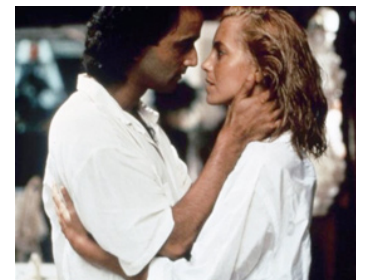
1992 TURTLE BEACH (Turtle Beach) de Stephen Wallace avec Art Malik