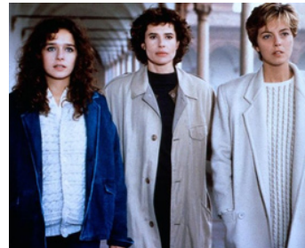
1988 TROIS SŒURS (Paura e Amore) de M. von Trotta avec Valeria Golino, Fanny Ardant