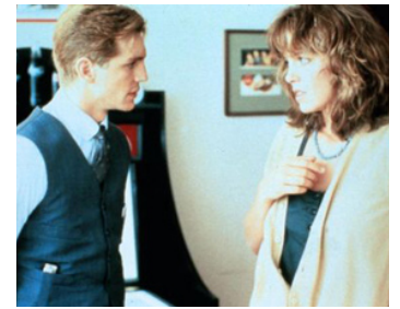
1984 COCA-COLA KID (Coca-Cola Kid) de Dusan Makavejev avec Eric Roberts