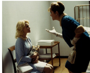
2004 BEYOND THE SEA (Beyond the Sea) de Kevin Spacey avec Kate Bosworth