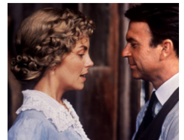
1994 AMOURS CHAMPÊTRES (Country Life) de Michael Blakemore avec Sam Neill