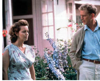
1999 COTTON MARY (Cotton Mary) d'Ismail Merchant avec James Wilby