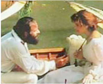
1984 BURKE ET WILLIS (Burke and Willis) de Graeme Clifford avec Jack Thompson