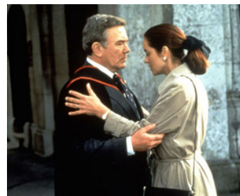
1994 LES LEÇONS DE LA VIE (The Browning Version) de Mike Figgis avec Albert Finney