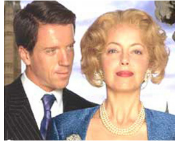
2002 JEFFREY ARCHER (Jeffrey Archer, the Truth) de Guy Jenkin avec Damian Lewis