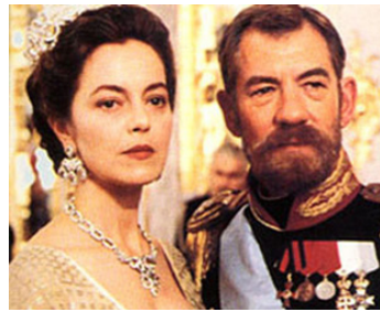
1996 RASPOUTINE (Rapustin) d'Uli Edel (TV) avec Ian McKellen