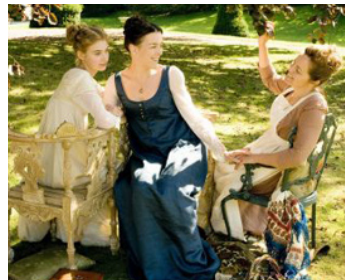
2008 LE CHOIX DE JANE (Miss Austen Regrets) de J. Lovering avec Imogene Poots, O. Williams