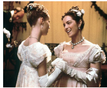
1996 EMMA L'ENTREMETTEUSE (Emma) de Douglas McGrath avec Gwyneth Paltrow