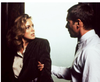
1990 PRÉSUMÉ INNOCENT (Presumed Innocent) d'Alan J. Pakula avec Harrison Ford