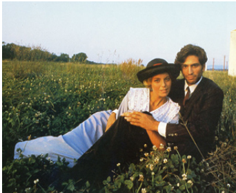
1987 GOOD MORNING, BABYLON de Paolo et Vittorio Taviani avec Joaquim D'Almeida