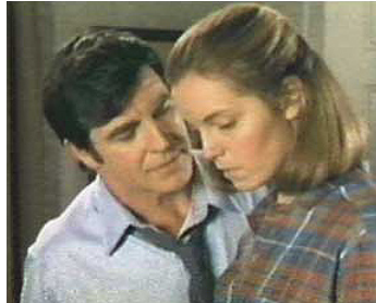
1985 DOCTEUR FISCHER DE GENÈVE (Dr Fischer of Geneva) de M. Lindsay-Hogg avec Alan Bates