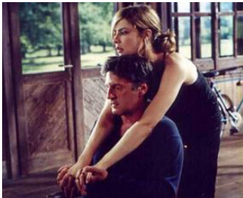
2004 LE PRIX DU DÉSIR (Sotto Falso Nome) de Roberto Ando avec Daniel Auteuil