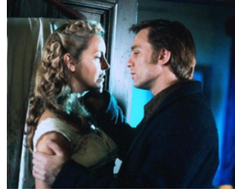
1998 TERREUR À ACHILL ISLAND (Love and Rage) de Cathal Black avec Daniel Craig