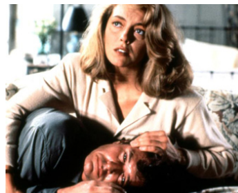
1991 TROUBLES (Shattered) de Wolfgang Petersen avec Tom Berenger