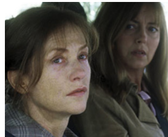
2009 L'AMOUR CACHÉ (L'Amore nascosto) d'Alessandro Capone avec Isabelle Huppert