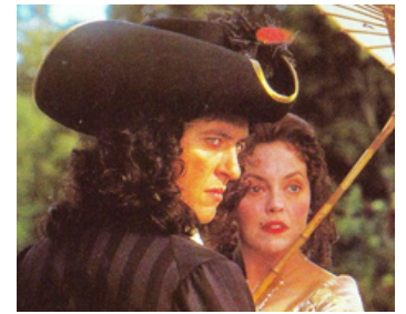
1997 LE BAISER DU SERPENT (The Serpent's Kiss) de Philippe Rousselet avec Vincent Pérez