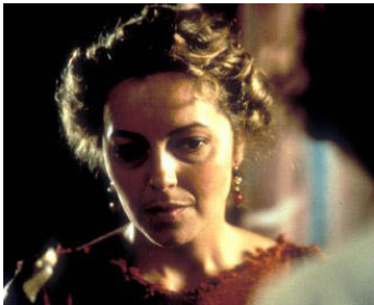
1997 L'ODYSSÉE (The Odyssey), pour la TV d'Andrei Konchalovsky