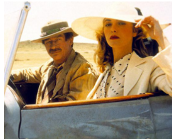
1987 SUR LA ROUTE DE NAIROBI (White Mischief) de Michael Radford avec John Hurt