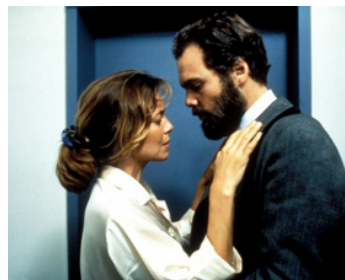
1992 LES VAISSEAUX DU CŒUR (Salt on our Skin) d'Andrew Birkin avec Vincent D'Onofrio