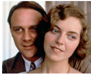
1982 CHALEUR ET POUSSIÈRE (Heat and Dust) de James Ivory avec Christopher Caze