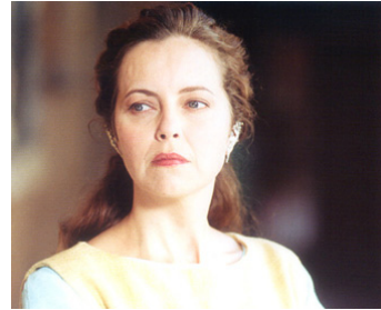
2003 LE BOURDONNEMENT DES MOUCHES (Il Ronzio delle Mosche) de Dario D'Ambrosio