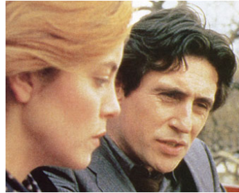
1984 DEFENCE OF THE REALM de David Drury avec Gabriel Byrne