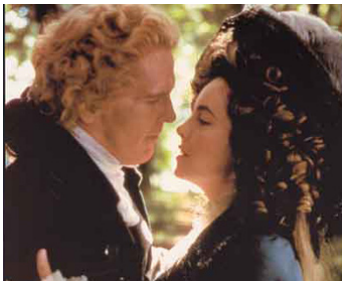
1995 JEFFERSON À PARIS (Jefferson in Paris) de James Ivory avec Nick Nolte