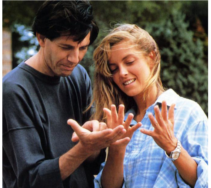
1987 UN HOMME AMOUREUX (A Man in Love) de Diane Kurys avec Peter Coyote