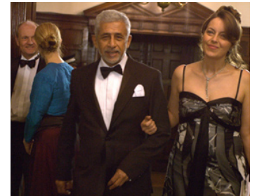
2007 TIR À VUE (Shoot on Sight) de Jag Mundhra avec Naseeruddin Shah