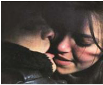
1982 LE DEUXIÈME VISAGE (Das Zweite Gesicht) de Dominik Graf avec Thomas Schütke