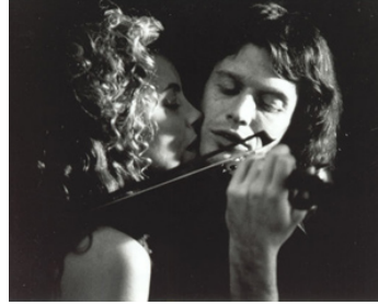
1998 LE VIOLON ROUGE (The Red Violin) de François Girard avec Jason Flemyng