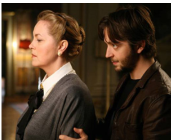
2007 UN AUTRE MONDE (Un Altro Mondo) de S. Muccino avec Silvio Muccino