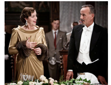
2011 HINDENBURG (Hindenburg) de Philipp Kadelbach avec Heiner Lauterbach