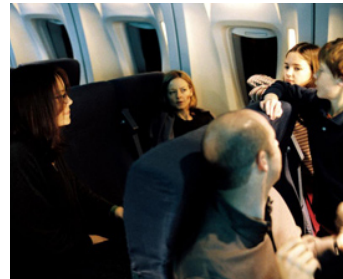
2005 FLIGHT PLAN (Flight Plan) de R. Schwenkte avec Jodie Foster Shande Edelman, H. Ramm